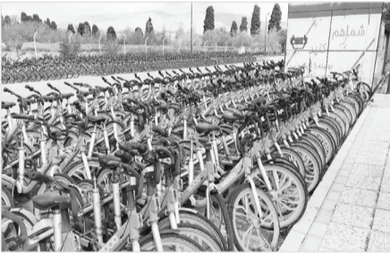
عنوان فاصله طبقاتی

این اتفاق در اردیبهشت ماه ۱۴۰۱ و بدون اطلاع‌رسانی به شهرداری شیراز و معاونت حمل و نقل ترافیک رقم خورد. روابط عمومی معاونت حمل و نقل و ترافیک شهرداری شیراز طی اطلاعیه‌ای اعلام کرد: درباره این طرح موضوعاتی مبنی بر جمع‌آوری دوچرخه‌های «بیدوده»، به منظور شفاف‌سازی این موضوع برای شهروندان عزیز شیرازی به استحضار می‌رساند: شهرداری شیراز در راستای حمایت از حمل و نقل پاک و بهره‌مندی از توان شرکت‌های دانش‌بنیان اقدام به انعقاد قرارداد سرمایه‌گذاری با شرکت پاک‌چرخ ایرانیان (بیدود) نمود. شرکت پاک‌چرخ ایرانیان بر خلاف تعهدات خود در قراردادی فای‌بین، تخلفات متعددی همچون تغییر مسدل ثبت‌نام، عدم افزایش سهمیه تحت پوشش، عدم افزایش تعداد دوچرخه‌ها و ایستگاه‌های دوچرخه مطابق با برنامه زمان‌بندی، دریافت مبالغی خلاف فر داد از شهروندان و... را انجام داد و در پاسخ به مکاتبات و اظهارهای متعدد، درخواست افزایش قابل توجه کرایه سفر و هزینه ثبت‌نام را